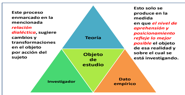
Figura 2. La triada investigador-teoría-dato alrededor del objeto de investigación.

posicionamientos que le relacionan al objeto. Estaríamos hablando de una triada investigador-teoría-dato que perseguiría conseguir un nivel de aprehensión suficiente del objeto de estudio (fig. 2).