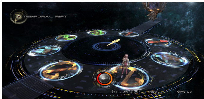
Figura 1. Vista del mini-juego “Hands of Time” que aparece en Final Fantasy XIII, ©Square Enix..

En este caso, el juego se considera de una clase cuya práctica exige poner en práctica habilidades, razonamientos o destrezas de corte matemático (Gairín, 1990). Es por eso que, desde el punto de vista de la enseñanza y el aprendizaje de las matemáticas, la búsqueda de soluciones en este tipo de juegos persigue metas como las siguientes: poder utilizar diferentes heurísticas, potenciar actitudes como la autoconfianza, la autodisciplina y la perseverancia (Morales & García, 2013).