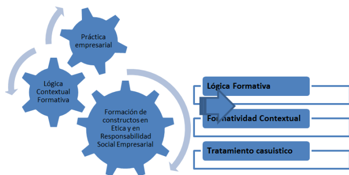
Figura 2. Estructuración modelativa de las acciones de formación.

Los cuales se constituyen en la piedra angular de la construcción ampliada de los procesos de formación y condicionan los métodos y prácticas de esta. Se orienta esta formación a configurar procesos direccionados por las carreras en los cuales se establecen lógicas grupales e individuales para asegurar el acceso de los estudiantes a las concepciones teóricas y metodológicas de la ética y la responsabilidad social en el ejercicio de los profesionales como empresarios.