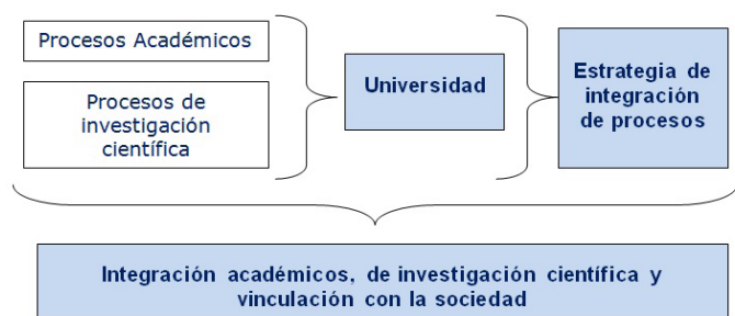
Figura 1. Retos de la universidad en su integración de procesos académicos, de investigación científica y de vinculación con la sociedad en el Ecuador.

A partir de las interrogantes antes expresadas la pertinencia de los procesos fundamentales universitarios con la sociedad constituye un elemento a tratar desde diferentes perspectivas para su consolidación. Los procesos de formación no deben limitarse solo a las investigaciones que realizan los estudiantes para graduarse. La formación continua y social debe tomarse en cuenta dentro de este proceso evaluativo. La figura 1 muestra un esquema que ilustra la interacción de los procesos fundamentales universitarios en su integración social.