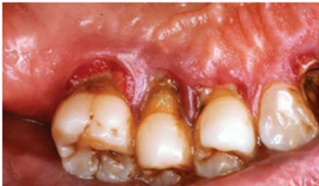
Figura 1. Enfermedad Periodontal en un paciente con diabetes mellitus.