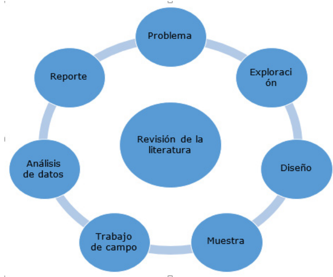
Figura 2. Proceso de Investigación Cualitativo

La población estuvo constituida por 15 docentes de la Carrera de Derecho de Uniandes Quevedo. Como criterios a considerar se tuvieron en cuenta, la formación continua durante toda la vida, la vinculación de la Universidad con su entorno y las oportunidades que provienen de la sociedad del conocimiento.