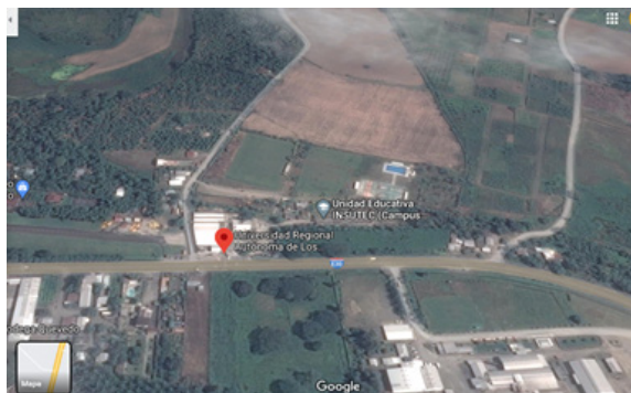
Figura 1. UNIANDES Quevedo

La investigación se realizó en la UNIANDES Quevedo, ubicada en zona urbana, región costa, provincia Los Ríos, Ecuador.