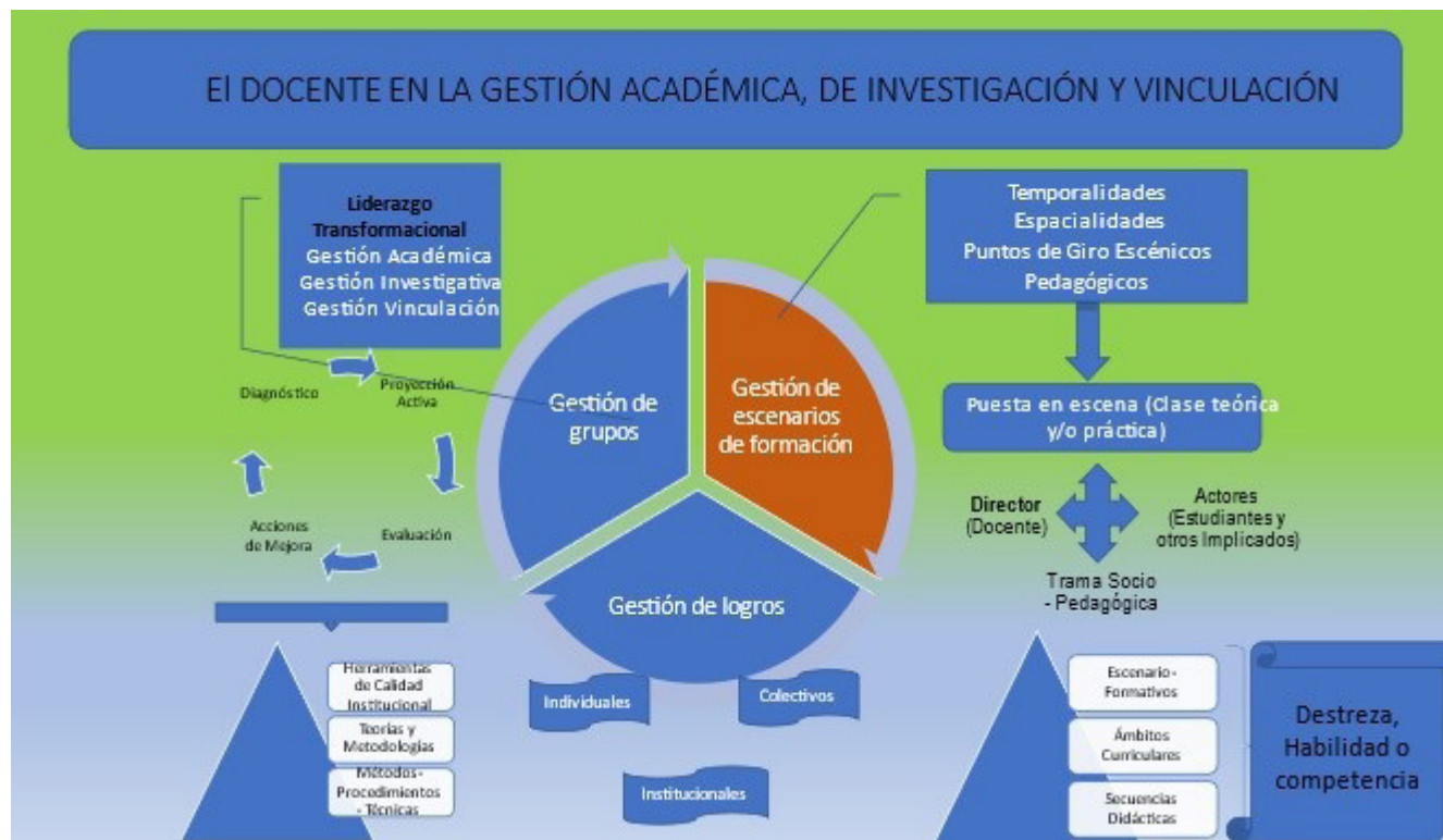
Figura 1. El Docente en la Gestión académica, Investigativa y de Vinculación

La formación profesional, presupone trabajar desde la función academia, el currículo reglado y en es necesario abordar dentro de esta temática, el “currículo oculto” a lo cual se agrega el modo en el cual, durante los procesos de vinculación, los docentes generan escenarios de apropiación cultural para los estudiantes. Se valora también la contribución que realiza la función investigación en la generación de procesos de actualización académica y de refuerzo formativo en los docentes, desde los problemas profesionales que se revelan en las actividades de vinculación y prácticas preprofesionales.