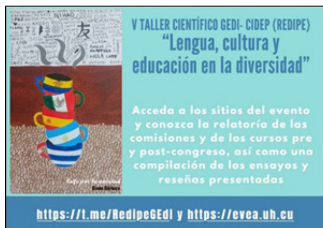
Figura 12. Invitación a la consulta de los resultados finales del V Taller.

Para promover la lectura de los resultados del Taller a partir de las relatorías de las comisiones y los cursos, las colecciones de reseñas y ensayos de los cursistas junto con las valoraciones de los profesores de los diferentes cursos, así como el resumen general del evento incluyendo el análisis de las encuestas y observaciones realizadas, se diseñó y envió a cada participante una invitación personal.