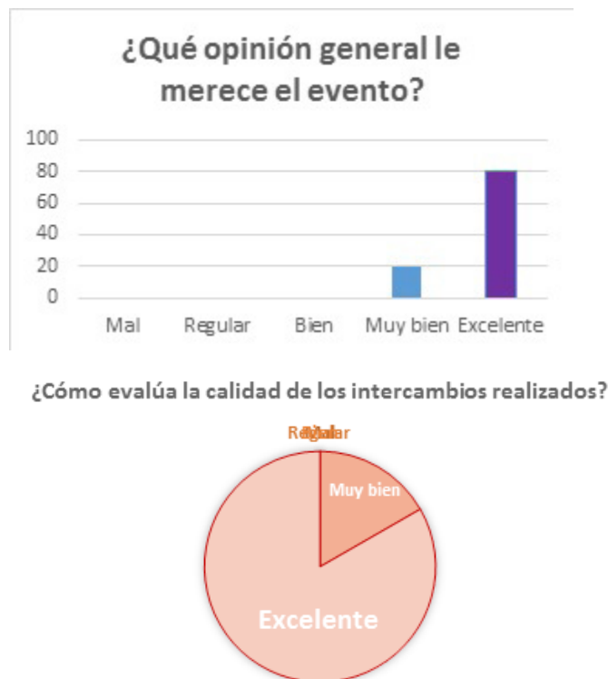
Figura 11. Valoración general de los participantes acerca de V Taller GEdi.

Las valoraciones expresadas por los participantes en las encuestas realizadas y los observadores, expresan criterios muy positivos sobre el Taller y el alto impacto académico, científico y profesional alcanzado, al considerarlo un evento: