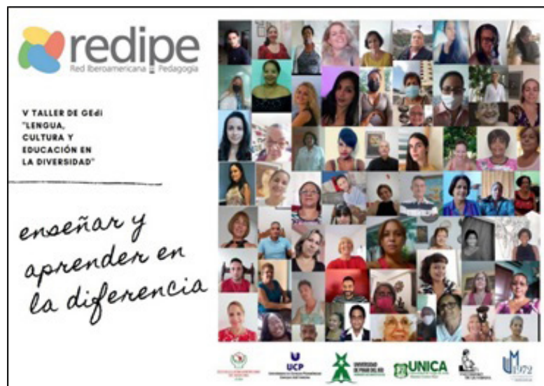
Figura 10. Fotocollage de los participantes en el V Taller GEdi.

Como resultado del procesamiento de los datos derivados de las encuestas realizadas a los participantes directos del evento y las observaciones llevadas a cabo por dos evaluadores externos, se pudo constatar que el 80 % de los encuestados consideró el evento de excelente y el 20 % de muy bueno. De igual forma, el 93.3 % reconoció de excelente su organización y coordinación, mientras el 83.3 % le atribuyó el máximo de calidad a los intercambios logrados en los foros interactivos desarrollados.