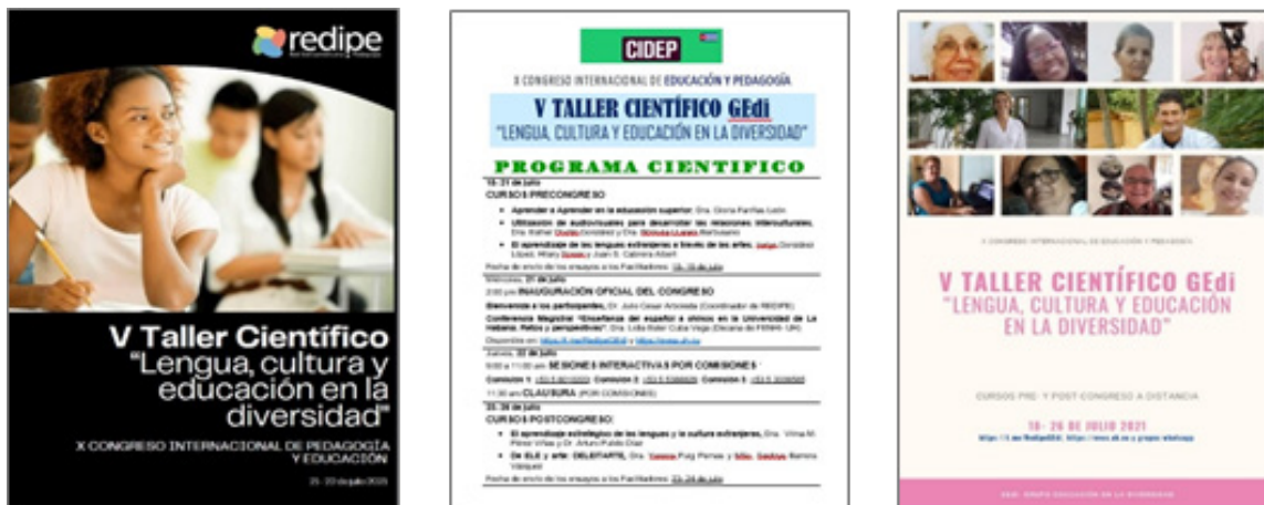
Figura 6. Posters promocionales del V Taller GEdi, su Programa General y Cursos Pre/Post- Congreso.

Estas acciones promocionales intencionadas desde el Grupo de Coordinación del Taller por medio de whatsapp, fueron replicadas también a través de los recién creados sitios en Telegram ( https://t.me/REDIPEGEdi ) y EVEA ( https://evea.uh.cu ), devenidos todos en su conjunto desde entonces, plataforma del evento.