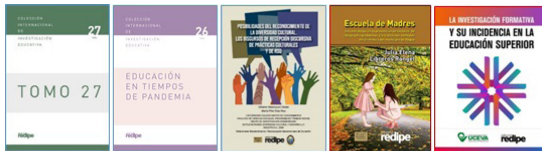
Figura 1. Muestra del catálogo de publicación de la Editorial REDIPE.

En términos de difusión del conocimiento, REDIPE cuenta con un amplio sistema de publicaciones, incluidas las colecciones de libro impresas: Colección Iberoamericana de Pedagogía y Colección Iberoamericana de Educación.