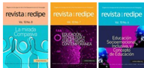
Figura 2. Muestra de los números más recientes de la revista Boletín de REDIPE.

Asimismo, la red cuenta con un órgano de divulgación científica: la Revista Boletín REDIPE , la cual es una publicación de circulación mensual, especializada, electrónica e internacional, en el cual se publican artículos de investigación, revisión y reflexión en las diferentes áreas y campos de la educación y la pedagogía. Está dirigida a la comunidad educativa, científica, profesionales e investigadores de la educación en general. Los artículos son manipulados en forma electrónica, siendo revisados por el comité científico, y por evaluadores anónimos.