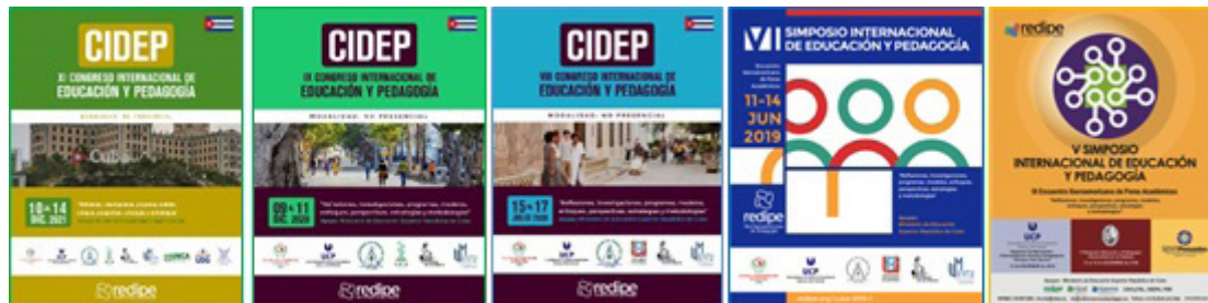
Figura 4. Posters promocionales de los congresos CIDEP- REDIPE (Cuba).

El Taller Internacional GEdi “Lengua, Cultura y Educación en la diversidad” es coordinado desde su primera edición en diciembre de 2018, por el Grupo de Investigación de la Comprensión y Aprendizaje (GICA), integrado por 211 afiliados en representación de 18 instituciones educativas del país, todos sincronizados alrededor de tres ejes temáticos fundamentales: