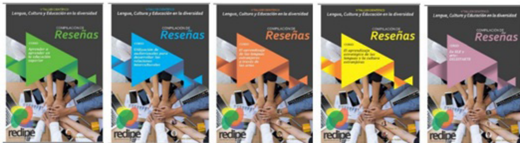
Figura 9. Colecciones de reseñas y ensayos derivados de los Cursos Pre/post- Congreso del V Taller GEdi. De igual forma, se compartió un fotocollage de todos los participantes en el evento

Como parte del cierre final del Taller, fueron publicados en los sitios del evento las relatorías correspondientes a cada comisión, así como las reseñas y ensayos de los cursos desarrollados, acompañadas de las valoraciones de cada profesor sobre los trabajos de los más de 130 cursistas participantes.