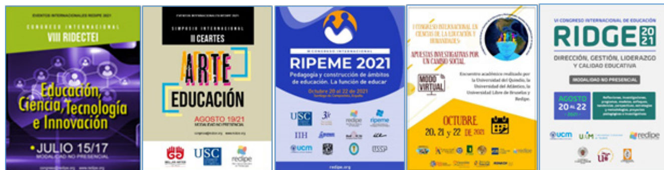
Figura 3. Muestra de posters promocionales de algunos de los congresos de REDIPE.

El plan de eventos internacionales de REDIPE cubre cada año un amplio y variado espectro de temas educativos con el objetivo de generar espacios de intercambio entre estudiantes, profesores, directivos y otros agentes educativos y organizacionales de todos los programas, niveles, áreas y ámbitos de la educación, e interesados, que indagan y participan activamente en la generación de espacios más humanos para la vida desde los ámbitos de la ciencia, la tecnología, la pedagogía y didáctica, otros ejes temáticos en los diversos niveles y áreas de la formación presencial y virtual; además de constituir y/o fortalecer macroproyectos pedagógicos e investigativos, redes y vínculos frente a los retos y desafíos de educar para mundos mejores desde los ámbitos en referencia.