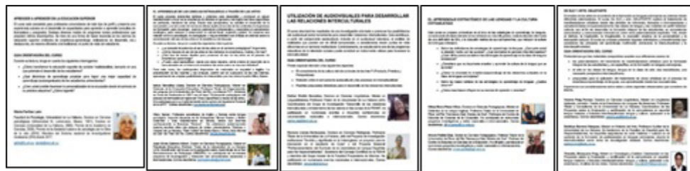
Figura 8. Sueltos promocionales de los Cursos Pre/post- Congreso del V Taller GEdi.

De esta forma, el V Taller Científico “Lengua, cultura y educación en la diversidad” , del X Congreso Internacional de Educación y Pedagogía CIDEP, inició el 18 de julio con los cursos pre- congreso. A las 9:00 am de este día, los matriculados en cada curso, pudieron acceder a los diferentes repositorios de materiales dispuestos preliminarmente en los sitios del evento y descargar estos directamente. Para elaborar y enviar a los profesores sus reseñas o ensayos sobre los temas abordados, los cursistas dispusieron de 3 días, al cabo de los cuales los profesores emitieron y publicaron por las diferentes vías, sus valoraciones sobre los trabajos recibidos