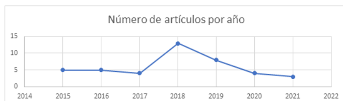
Figura 1. Número de publicaciones en psicooncología pediátrica.

En cuanto al número de publicaciones en los últimos 7 años, durante el 2018 se presentó el mayor número de indexados, seguido del 2019; en los otros años la constante ha sido de 4 a 5 artículos (ver figura 1).