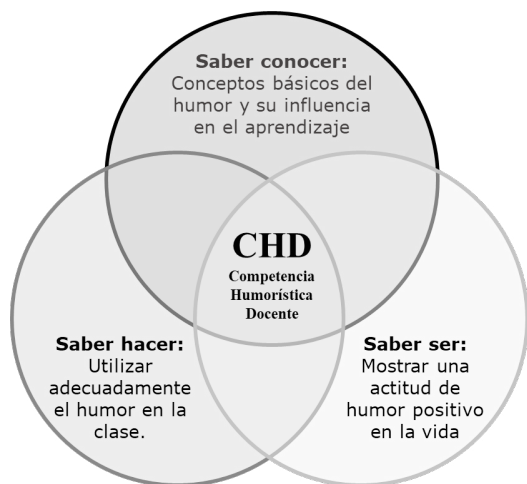
Figura 2. Dimensiones de la competencia humorística docente (CHD).

Finalmente, el uso del humor en las clases por parte del docente debe ser lo más auténtico posible, esto lleva al saber ser, enlazado a las actitudes y valores que facilitan el desarrollo de una competencia. Es así, que en la Competencia Humorística Docente (CHD) el docente es capaz de mostrar una actitud de humor positivo en los diferentes aspectos de su vida y no solamente circunscrito a las aulas de clases. Esto involucra que el docente pueda utilizar el humor en diversos entornos sociales, favoreciendo sus relaciones interpersonales y perfeccionando sus habilidades comunicativas. Por lo tanto, la convergencia de estas tres dimensiones (Figura 2) formaría la competencia humorística docente (CHD).