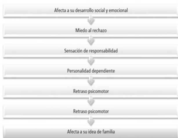
Figura 1. secuelas psicológicas asociadas al abandono en la niñez y la adolescencia