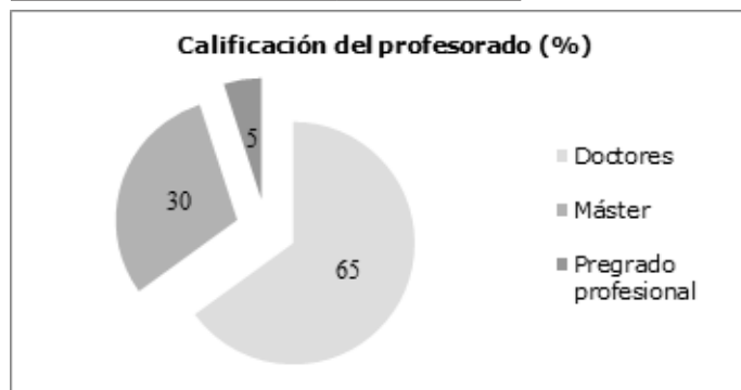
Figura 1. Tipos de posgrados.

La universidad cuenta con un personal docente compuesto de 840 de cátedra y 630 profesores de planta de los cuales el 65% cuenta con título doctorado, 30% de maestría y 5% de pregrado-profesional (Tabla 2 y Figura 2).