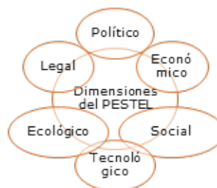
Figura 1. Dimensiones del PESTEL.

los índices de desigualdad, el desarrollo económico, el acceso a recursos de sus habitantes, así como la forma en que todo ello afecta a la actividad de la empresa como lo demuestra la figura 1