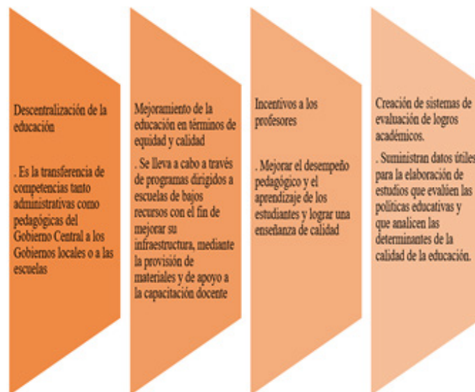
Figura 2. Políticas educativas.

Dentro de las políticas públicas educativas (Figura 2) deben existir mecanismos normativos y procedimentales claros y precisos, que aseguren la igualdad de derechos para hombres y mujeres. Medidas especiales de carácter temporal orientadas a acelerar la igualdad de derechos en la educación.