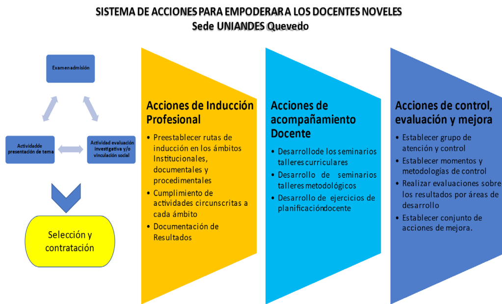
Figura 2 Sistema de acciones para empoderar a los docentes noveles

El resultado fundamental alcanzado se concreta en el sistema de acciones Figura 2 para empoderar a los docentes noveles en la universidad UNIANDES Quevedo.