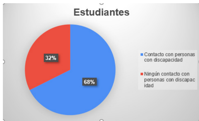
Figura 2. Estudiantes con contacto con personas con discapacidad. Guayaquil, 2022

Los participantes han tenido contacto estrecho o amistad con personas con discapacidad a lo largo de su vida, lo cual se evidencia en la figura 2, donde dicha interacción representó el 68 %. Este dato muestra la importancia de educar en la sensibilización de su inclusión en los diferentes espacios (académico, laboral social). En décadas atrás, a las personas con discapacidad se les ocultaba de la sociedad, e inclusive en algunos círculos hasta se les consideraban como un castigo divino por los pecados de sus padres, razón por la cual eran reclusos en casas o internados.