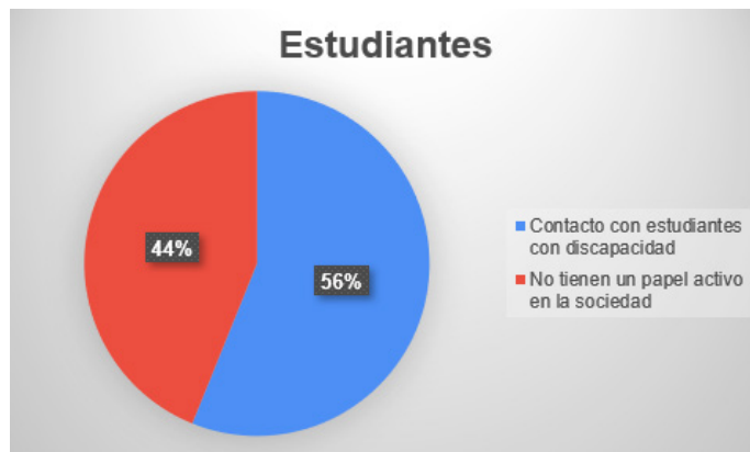
Figura 3: Estudiantes con compañeros con discapacidades. Guayaquil, 2022

está asociado al efecto de las adaptaciones curriculares desarrolladas en el ámbito escolar y colegial, facilitando su ingreso al desarrollo de carreras de tercer nivel. Esta inclusión se vuelve, en muchos casos, difícil, debido a la ausencia de infraestructuras, tecnologías y protocolos universitarios para lograr un desarrollo académico acorde a las necesidades educativas especiales y su proceso de enseñanza aprendizaje, por lo cual se afectan los derechos de los estudiantes a la educación.