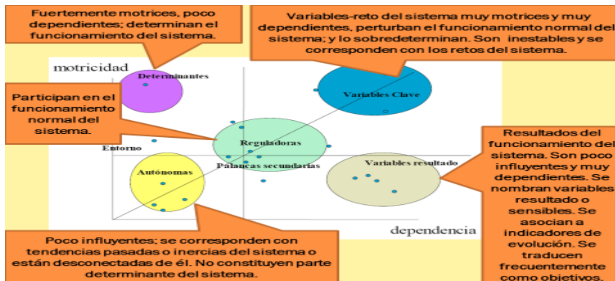
Figura 1: Eje o plano estratégico

Una vez establecidas las influencias que un indicador ejerce sobre otro, se obtienen los resultados de las matrices, las características, suma, estabilidad, plano, gráfico y se edita el informe. Posteriormente, se analiza el informe y cada factor obtiene una clasificación según el plano en que se ubique, como se observa en el eje estratégico o plano que se muestra en la figura 1.