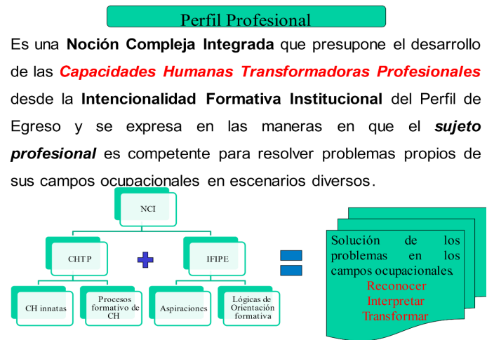
Figura 1. Lógica estructural de interpretación epistémica de la categoría Perfil Profesional

Para poder explicar la postura y consideraciones epistémicas a las que se ha arribado se parte de la figura 1 que a continuación se presenta. En esta imagen, se establece el concepto al cual se arribó y se estructuran las configuraciones que permiten establecer rutas de trabajo en la universidad para alcanzar los logros de aprendizaje que los alumnos evidencian en su perfil de egreso.