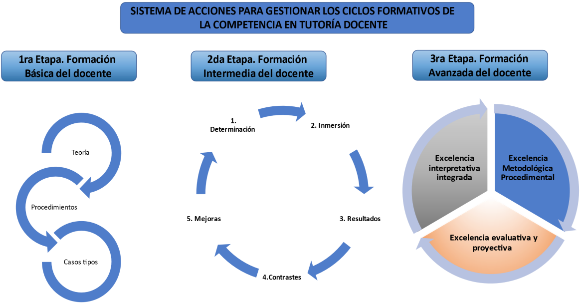
Figura 2. Sistema de gestión de ciclos formativos del docente