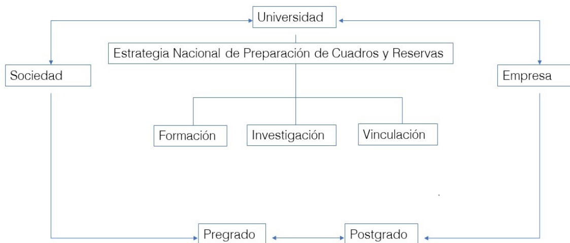
Figura 2. Esquema que representa la tríada Sistema de conocimientos de las asignaturas, Estrategia Nacional de Preparación y Superación de Cuadros y Reglamento de Postgrado.

Educación Superior, 2019b). lo que corroboró que la tríada Sistema de conocimientos de las asignaturas, Estrategia Nacional de Preparación y Superación de Cuadros, Reglamento de Postgrado, resulta viable para contribuir a la vinculación Universidad-Empresa, toda vez que puede hacer posible que el conocimiento y empleo de la teoría, los métodos, técnicas y herramientas que la ciencia de la dirección ha desarrollado puede contribuir a la preparación de los directivos y de los que tienen potencialidades para ocupar cargos de dirección. Esquemáticamente (Figura 2), la vinculación entre estos tres aspectos se aprecia de la siguiente forma: