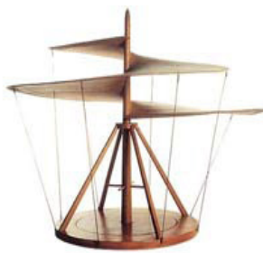
Figura. 5 Tornillo aéreo