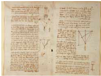
Figura.1 Escritura especular