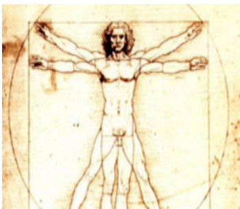
Figura. 10 El hombre vitrubiano