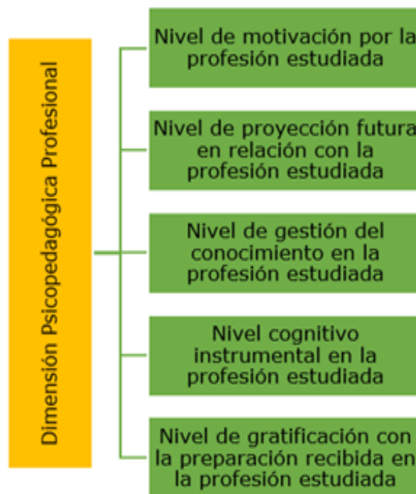
Fig. 3. Dimensión Psicopedagógica Profesional del Crecimiento Personal.

Dimensión 3. Psicopedagógica Profesional (figura 3): expresa el contenido del crecimiento personal en relación al proyecto de vida profesional determinado por el psicopedagogo en formación inicial. Permite la adecuada proyección futura con vistas a su la realización personal y profesional, a partir del planteamiento de objetivos, metas, planes o proyectos a corto, mediano y largo plazo para alcanzar propósitos.