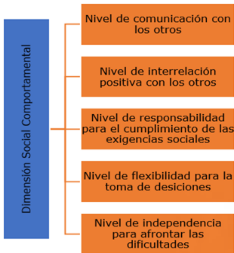
Fig. 1: Dimensión Social Comportamental del Crecimiento Personal.

Dimensión 1. Social Comportamental (figura1): expresa el contenido del crecimiento personal en relación al establecimiento de la relación mediada por la actividad y la comunicación, que establece el psicopedagogo en formación inicial con los demás, consigo mismo y con el medio. Significa una actitud activa en la búsqueda de maneras objetivas y responsables para comportarse y saber representarse cambios, logros y éxitos personales.