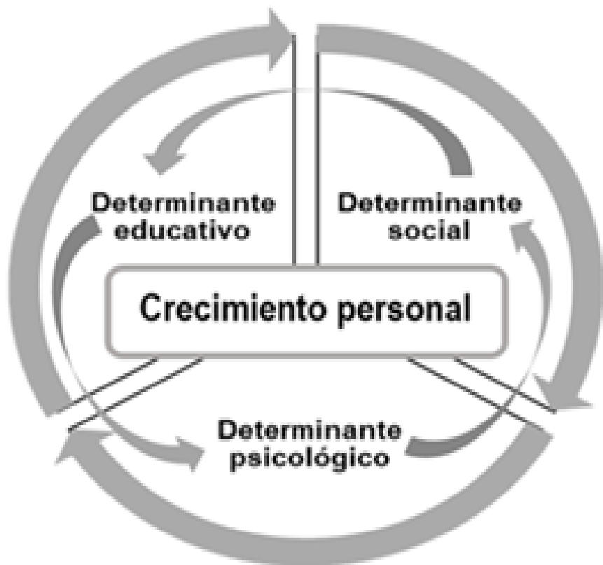
Fig. 4. Determinantes del crecimiento personal en la formación inicial del psicopedagogo.

El proceso de formación inicial, ofrece la visión del crecimiento personal del psicopedagogo desde una perspectiva sociopsicoeducativa, amplia, integral y compleja; como proceso y resultado que implica necesariamente las funciones: instructiva, educativa y desarrolladora. Los anteriores presupuestos develan la esencia sociopsicoeducativa de dicho proceso en particular, en esa dirección se connota la aprehensión, configuración y expresión sociopsicoeducativa del crecimiento personal a partir de sus determinantes (figura 4): determinante social, determinante psicológico y determinante educativo.