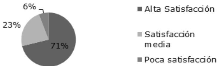
Figura 1. Niveles de satisfacción.

Por cuanto esta relación puede considerarse moderada y este resultado generalizarse para otros grupos de emprendedoras migrantes inscritas a programas de gobierno con el apoyo de fondos extranjeros. En el análisis de las acciones que se realizan como parte de las formas de capacitación para incrementar su preparación y la oportunidad de integración rápida y oportuna a la sociedad donde se desenvuelven, las encuestas reflejan algunos resultados con posibilidades de mejoras. Al referirse a la atención que el proyecto les proporciona, se puede observar que la mayoría considera les satisface (Figura 1).