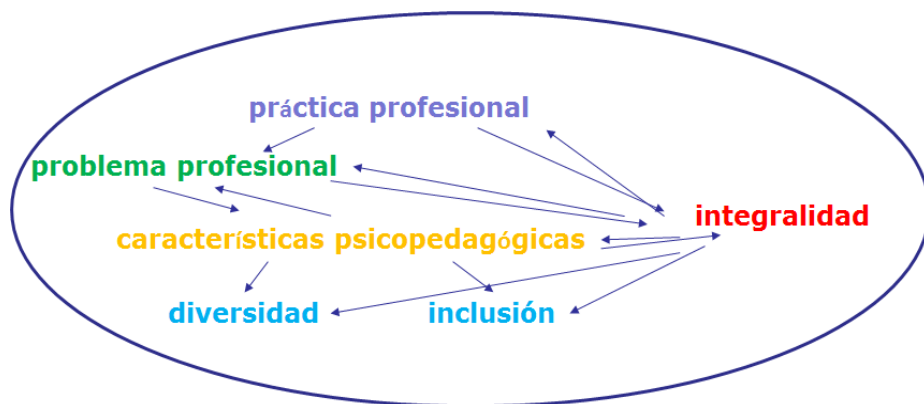
Fig. 2: Representa los nodos conceptuales identificados como resultado de las asociaciones en las redes semánticas

A partir de los nuevos análisis, codificación e interpretación se obtuvo una secuencia de categorías que posibilitaron profundizar acerca de las potencialidades de los contenidos y la práctica laboral de asignatura para la educación interprofesional pedagógica en la disciplina en su condición de tronco común. Mediante las redes semánticas se determinaron nodos conceptuales, se hicieron asociaciones por estar directamente conectados entre sí y se realizaron las interpretaciones para la asunción de los resultados y conclusiones (Figura 2).