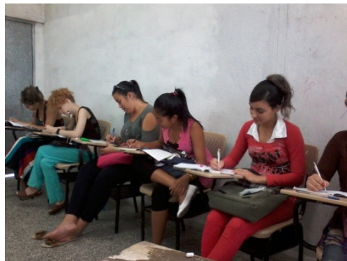
Figura 1. Taller de Tecnología de la Química. Estudiantes de 4.º Año. Sesión de preparación.

También se estudió la experiencia ecuatoriana desde el punto de vista de la ingeniería ambiental.