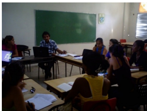
Figuras 2 y 3. Talleres de preparación y discusión de trabajos investigativos. Metodología de la Investigación Educativa. Estudiantes de 3. Año.

En la actualidad, algunos de los trabajos investigativos que se ya se desarrollan en este tercer año, son los siguientes: