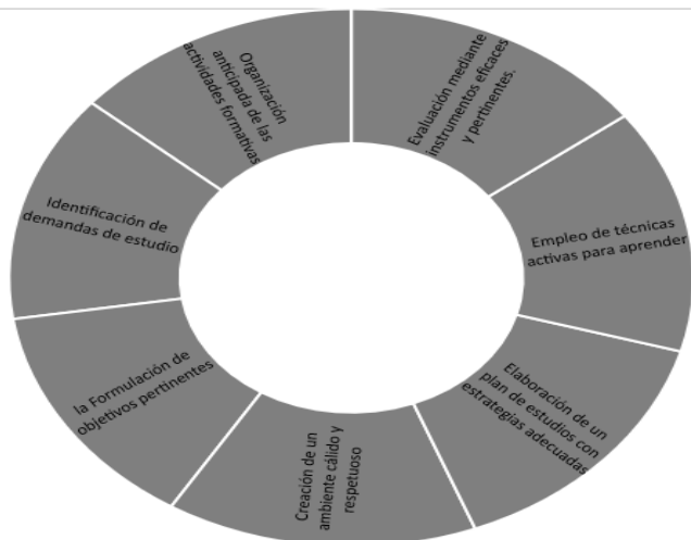
Figura: 3: Estructura metodológica,(Alonso, 2012) Propuesta por el INEA, para una planificación efectiva del proceso de instrucción – amaestramiento