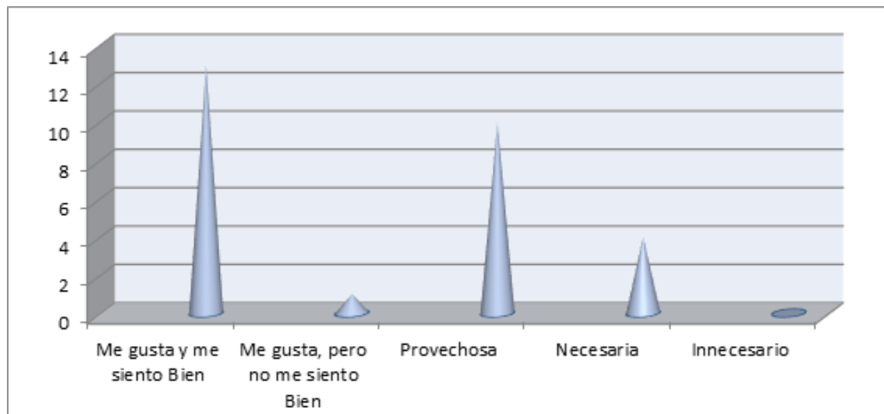
Gráfica 1. Criterios de los estudiantes

Lo anterior se puede percibir en la siguiente gráfica.