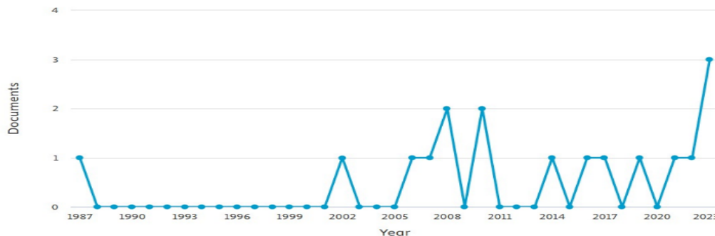
Figura 2: Desarrollo de la temática objeto de estudio.

Al determinar las categorías conceptuales de la investigación, se estudió el comportamiento en el tiempo, a partir las dos últimas del siglo XX, la presentación de estudios sobre la enseñanza de la Física en estudiantes con discapacidad auditiva (Figura 2)