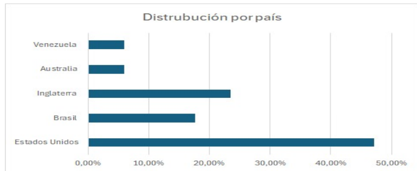
Figura 3: Distribución de revistas por país.

Algunas revistas como la de Medicina Académica: Academic Medicine (199 Q-1), Revista de Investigación y Desarrollo de la Rehabilitación: Journal of Rehabilitation Research (125 Q-1) y Educación en Tecnologías de la Información: Information Technology Education, (38 Q-1), muestran un alto factor de impacto, por ello podemos decir que son líderes en su disciplina, así como también en el número de citas. Por último, la (Figura 4 detalla la distribución de revistas por países.