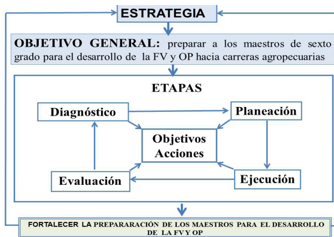
Figura 2. Estrategia para la preparación de los maestros para desarrollar la FV y OP hacia carreras agropecuarias.

A continuación, se muestra la representación gráfica de la estrategia